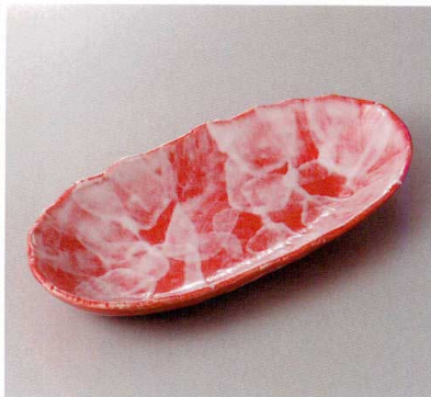
383-3-60H 2,050円 赤彩花ダ円長鉢 31.5×15.5×5.7cm