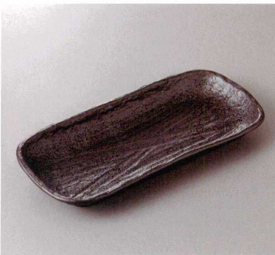
383-8-43H 1,750円 黒結晶和心ホッケ皿 33.7×15.5×3.7cm