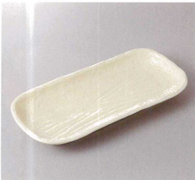
383-7-43H 1,750円 粉引和心ホッケ皿 33.7×15.5×3.7cm