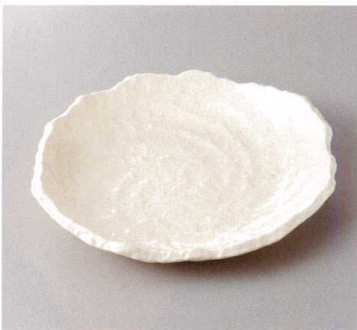
383-9-82H 1,650円 白軸8号変形皿 25×22×4cm