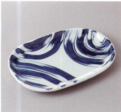
383-4-51H 2,000円 海流玉淵9.0小判皿 25.7×16.7×2.5cm