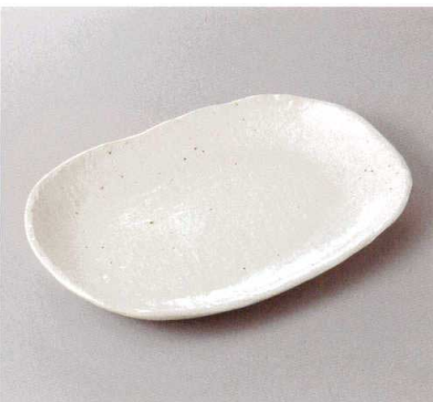
383-11-31H 1,500円 白粉引ワラジ楕円皿 27×18.3×2.8cm