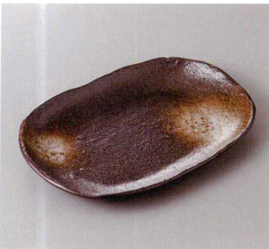
383-10-31H 1,500円 黒水晶ワラジ楕円皿 27×18.3×2.8cm