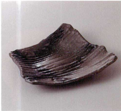
383-1-26H 2,400円 黒釉吹き三ツ足変形皿 24×19×5.2cm