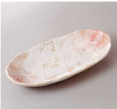
383-5-60H 2,000円 桜志野長小淵浅皿 32×15×4cm