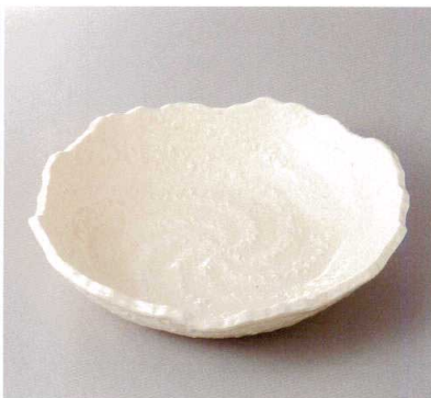
383-6-82H 1,850円 白軸8号浅鉢 25×22×5cm