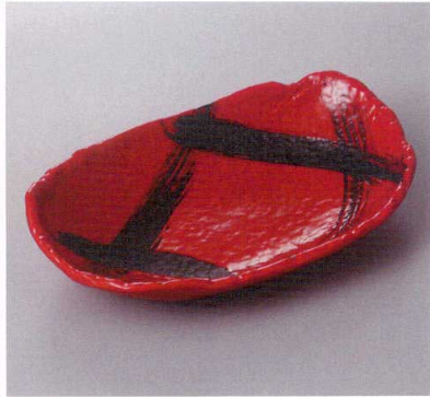
386-3-27H 1,350円 赤軸黒刷毛漬物鉢 21.2×14.5×4.5cm