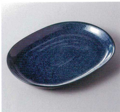
386-4-34H 1,400円 薫変紺楕円大皿 24.7×18.7×2.4cm