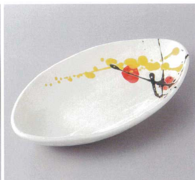
386-8-45H 1,100円 あけぼの楕円鉢中赤 24.5×13.5×4cm