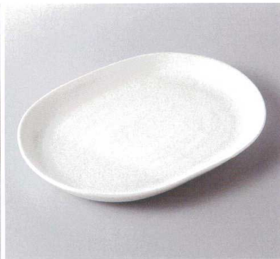
386-5-34H 1,400円 白軸楕円大皿 24.7×18.7×2.4cm