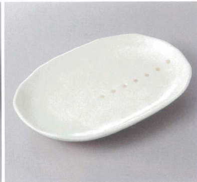
386-11-51H 930円 トト白スバゲティ皿 24.8×15.6×3.5cm