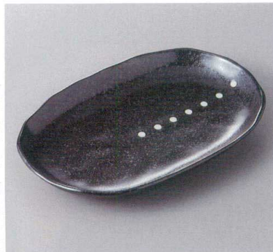
386-10-51H 930円 トト黒スバゲティ皿 24.8×15.6×3.5cm