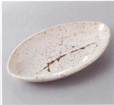
386-6-45H 1,100円 アメ乱楕円中鉢 24.5×13.3×4cm