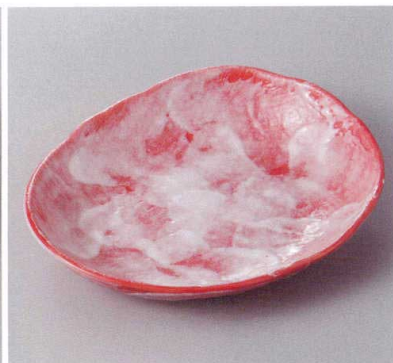
386-9-60H 900円 赤彩花夕円小皿 18.5×15.5×3cm