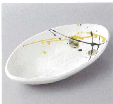
386-7-21H 1,100円 薄墨舟形鉢大 24.2×13.2×4cm