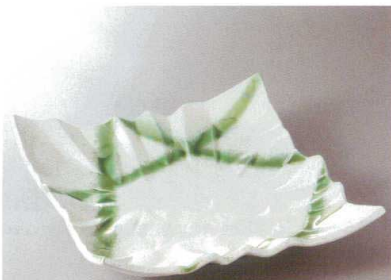
396-6-93H 23,000円 有田焼 ラスターカリン 樽子新紙10号皿 1入 32.5×32.5×9cm