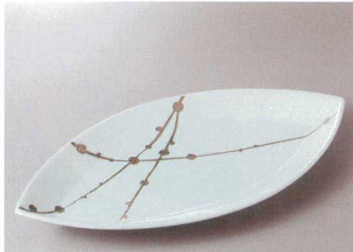
有田焼 錦白プラチナ玉すだれ

396-1-93H 60,000円 盛込皿(大) 1入 46×34×7cm 396-2-93H 40,000円 盛込皿(小) 1入 38×24.5×5.5cm