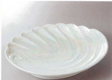
396-5-93H 30,000円 有田焼 ラスターあわび盛込皿 1入 41×33×6.7cm

396-3-93H 29,000円 リーフ50cm皿 1入 50×26×4.5cm 396-4-93H 21,000円 リーフ40cm皿 1入 41×20.5×4cm