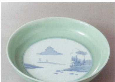
有田焼 青磁内山水

396-11-93H 47,500円 13号鉢鉢 2入 39×8cm 396-12-93H 38,500円 12号鉢鉢 3入 37×7.5cm 396-13-93H 24,600円 11号鉢鉢 3入 33.5×7cm 396-14-93H 17,000円 10号鉢鉢 3入 30.5×6.5cm 396-15-93H 12,000円 9号鉢鉢 3入 27.5×6cm 396-16-93H 7,800円 8号鉢鉢 3入 24.5×5cm 396-17-93H 5,800円 7号鉢鉢 5入 21×4.5cm