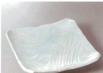
396-7-93H 18,000円 有田焼 ラスター渦盛皿 1入 31.5×31.5×6cm