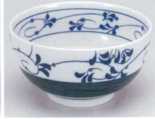
326-401-342 1,550円 波佐良焼 特選 ホタル5.0井 (15.2×7.8) 531210634