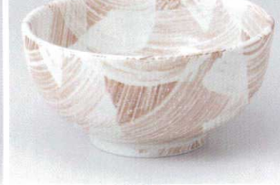
326-501-312 1,150円 ゴス散し5.0丸井 (15.8×7.7) 1033740431