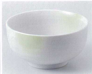
326-301-332 1,750円 白唐津切立5.0多用井 (15×8.5) 531160233