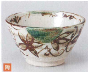
326-201-262 2,850円 黄交趾5.0多用井 (14.7×8.6) 933240426