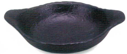
674-103-842 3,500円 ㊦ 黒7号盛鉢陶板 (29×23×7) 1071620484