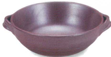
674-102-842 2,400円 ㊦ 耐熱鉄砂盛鉢ボール (23×20×7) 665040384