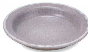
674-403-842 2,000円 ㊦ グレー柳川皿 (20×3) 564710584