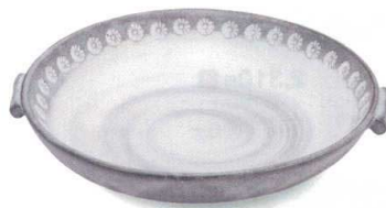
674-402-252 3,000円 ㊦ 三島紋耐熱土鍋皿 (23×21×4) 971630525