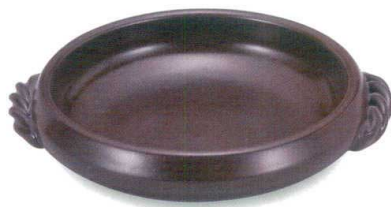
674-301-822 2,200円 ㊦ 6.0深陶板 (24.5×18.5×5) 564530684