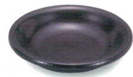
674-303-842 1,700円 ㊦ (黒)一人用浅鉢 (15.5×3) 971640184