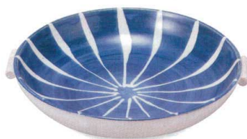
674-401-782 3,000円 ㊦ 呉須十草 土鍋皿 (23×21×4) 1172240178