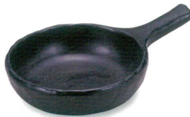
674-302-842 2,400円 ㊦ 黒片手フライパン (23×15×5.5) 1071610584