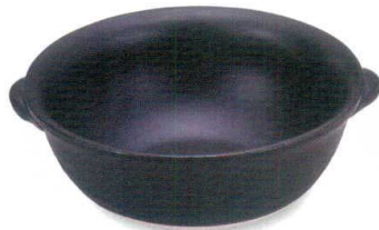
674-201-822 2,800円 ㊦ 超耐熱 漆黒拉麺鍋 (23×21×8) 764420382