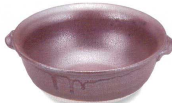
674-202-822 2,800円 ㊦ 超耐熱 鉄赤拉麺鍋 (23×21×8) 764420482