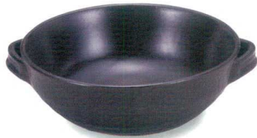
674-101-842 2,400円 ㊦ 耐熱黒釉盛鉢ボール (23×20×7) 665040184