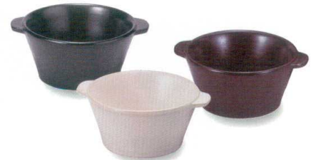
674-203-812 1,800円 ㊦ ブラックスタイルボウル 耐熱(16×13×6.5) 1172230181 674-204-812 1,800円 ㊦ ホワイトスタイルボウル 耐熱(16×13×6.5) 1070620881 674-205-812 1,800円 ㊦ ブラウンスタイルボウル 耐熱(16×13×6.5) 1070621181