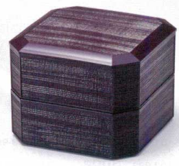
711-109-982 850円 5.0 焼杉隅切重 マロン内黒(蓋) (15.3×15.3×H1.3) 767510898