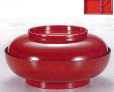
711-305-982 4,950円 8.0和弁当 朱内黒 (仕切:朱) (φ24×H12) 1271130598