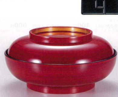
711-304-982 6,500円 8.0和弁当 曉かすり 内黒 ツマミ内金 (仕切:黒) (φ24×H12) 1271130498