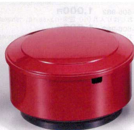
711-404-982 5,000円 5人飯器 朱 (φ25.8×H13.7) 1075540498