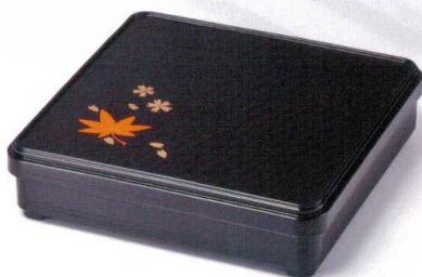
711-201-982 2,800円 8.0 角舞子弁当 黒 春秋 (24×24×H6) 767520298