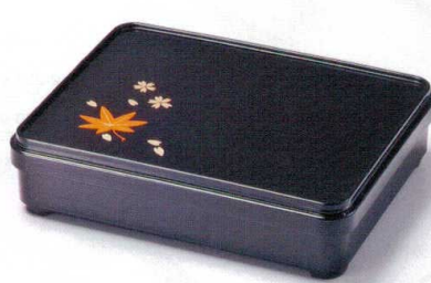
711-203-982 2,900円 8.5 長手舞子弁当 黒 春秋 (25.5×20×H6.2) 767520398