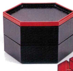
711-105-982 1,400円 6.0 六角布目弁当 黒縁朱(蓋) (17.5×17.5×H1.5) 973910598