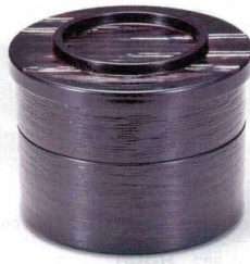
711-103-982 4,800円 へぎ目丸重 溜内朱 (二段:仕切付) (φ16.2×H12.5) 767510498