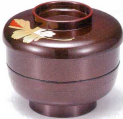
711-101-982 4,900円 大平弁当 金パール内朱 一枚菊(二段:仕切付) (φ17.5×H14.6) 767510298