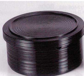
711-401-982 9,500円 乱筋飯器(5人用) 溜 (φ26.4×H13.2) 767540398