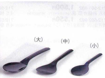
711-410-982 450円 杓子(大) 黒(22.3×6) 767540998