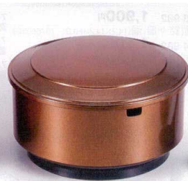
711-407-982 5,400円 5人飯器 梨子地 (φ25.8×H13.7) 1075540798