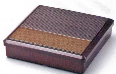
711-204-982 3,850円 トンカツ弁当 金パール内朱 四海波 (24.2×24.2×H6) 767520498