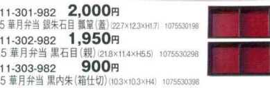
711-301-982 2,000円 7.5 華月弁当 銀朱石目 瓢箪(蓋) (22.7×12.3×H1.7) 1075530198