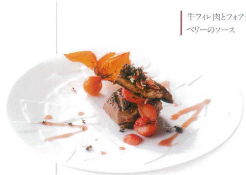
牛フィレ肉とフォアグラ ベリーソース

084-00-402 市松 27cmディナー ¥3,100 D27.2×H2.9 RF(特白磁)