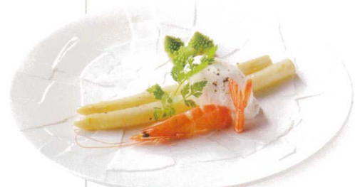
ホワイトアスパラ ポーチドエッグのせ

084-41-402 市松 ビスク 27cmディナー ¥4,400 D27.2×H2.9 RF(特白磁)