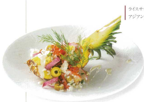
ライスサラダ アジアン仕立て

084-00-402 市松 27cmディナー ¥3,100 D27.2×H2.9 RF(特白磁)