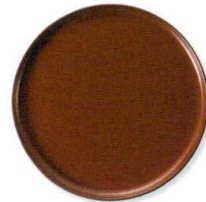
750-00-845 7.5丸浅口切立皿 ¥3,400 D22.9×H1.7 RF [食洗機×][レンジ×]