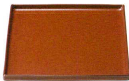
750-00-387 24cm浅口切立正角皿 ¥5,600 D24.5×H1.7 RF [食洗機×][レンジ×]