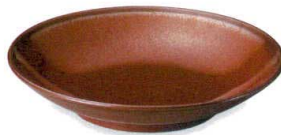
750-00-050 尺.0盛鉢 ¥8,000 D30.1×H5.7 RF [食洗機×][レンジ×]