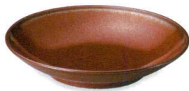
750-00-043 9.0盛鉢 ¥5,100 D28.2×H5.5 RF [食洗機×][レンジ×]