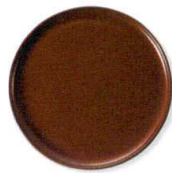
750-00-838 6.0丸浅口切立皿 ¥1,800 D19×H1.6 RF [食洗機×][レンジ×]