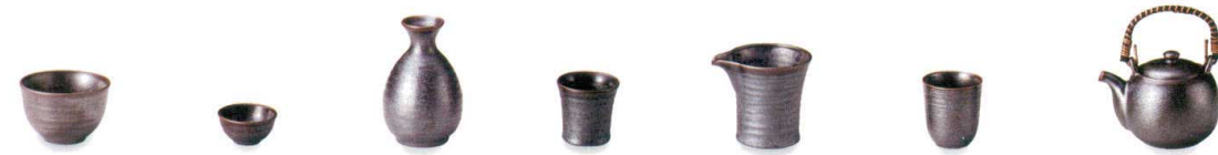
751-00-638 2.8煎茶 ¥680 D8.5×H5.6・175cc RF 751-00-376 ぐい呑 ¥530 D6.4×H3.4・50cc RF 751-00-382 1合徳利 ¥1,200 H10.8×D6.9・160cc RF 751-00-611 冷酒杯 ¥830 D6.6×H6.5・110cc RF 751-00-610 冷酒器 ¥1,900 L10.6×S8.9×H9.5 280cc RF 751-00-633 2.3長湯呑 ¥850 D6.8×H7.8・170cc RF 751-00-098 3合土瓶 ¥4,800 L13.6×S10.5×H10.2 480cc RF 000-00-021 土瓶茶こし ¥630 D6.7×H5.9 000-00-020 土瓶つる ¥550 L9×S1.1×H10 ※茶こし、つる 別売りです。