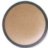
370-00-008 7.0皿 ¥2,100 D20.9×H3.3 OF