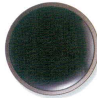
179-00-010 8.0皿 ¥3,300 D24.1×H3.6 OF