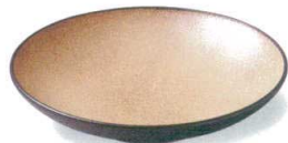
370-00-287 8.5めん皿 ¥4,800 D25.9×H5.6 OF