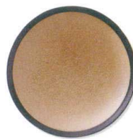
370-00-010 8.0皿 ¥3,800 D24.1×H3.6 OF