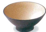
370-00-328 5.0大茶 ¥1,900 D15.2×H7 OF