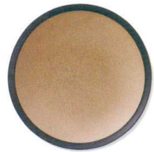
370-00-012 9.0皿 ¥4,600 D27.8×H4 OF