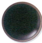
179-00-008 7.0皿 ¥1,800 D20.9×H3.3 OF