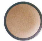
370-00-006 6.0皿 ¥1,800 D18.5×H2.8 OF