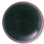
179-00-006 6.0皿 ¥1,600 D18.5×H2.8 OF