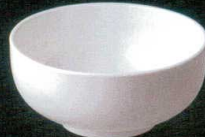
573-00-261 6.0深井 ¥2,700 D18.2×H8.3・1090cc RF