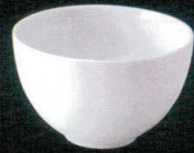
573-00-292 14cm多用丼 ¥1,650 D14×H8.7 RF