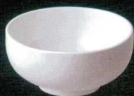
573-00-259 5.5深井 ¥2,200 D16.7×H7.9・1100cc RF