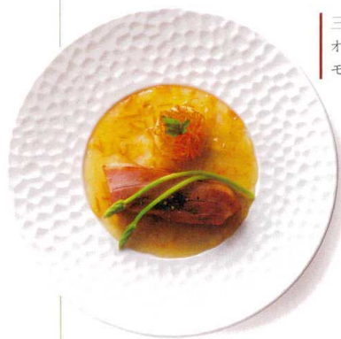
三元豚のベーコン オレンジソース にんじんの モンブラン仕立て添え

471-00-402 NUNOME 27cmディナー ¥3,300 D27.8×H2.2 ID11.5 RF(特白磁)