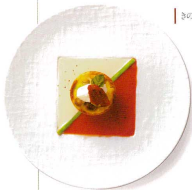
きのことそら豆のタルト紅白ソース

471-00-402 NUNOME 27cmディナー ¥3,300 D27.8×H2.2 ID11.5 RF(特白磁)