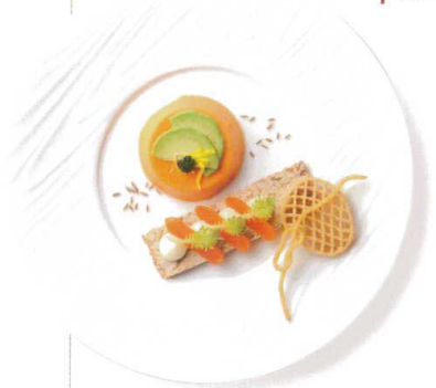
アボカドとパプリカのムース からすみのカナッペ添え

003-00-402 エレナ 27cmディナー ¥3,100 D26.5×H3 ID19.7 RF (強化セラミック)