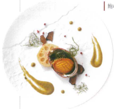
鮑のステーキ肝のソース

340-00-405 CHIGIRI 28cmディナー ¥3,100 D27.5×H2.2 RF(特白磁)