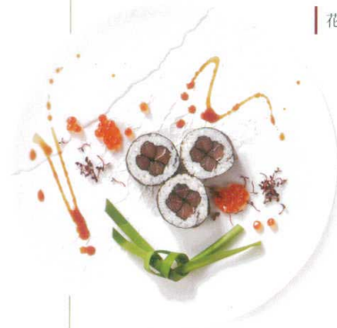
花鉄火巻きポルト酒のソース

340-00-405 CHIGIRI 28cmディナー ¥3,100 D27.5×H2.2 RF(特白磁)