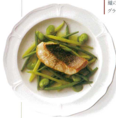
鱈のポワレ2色のインゲン豆の グラッセと共に

340-37-405 CHIGIRI 28cmディナー-BK ¥5,300 D27.2×H2.9 OF(特白磁)