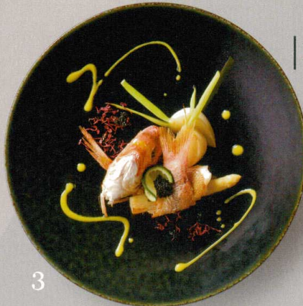
チダイとホワイトアスパラの ロティール