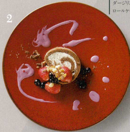
ダーズリンティ어의 ロールケーキ