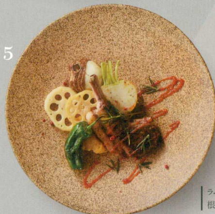
5 ラムチョップと 根菜のロティール