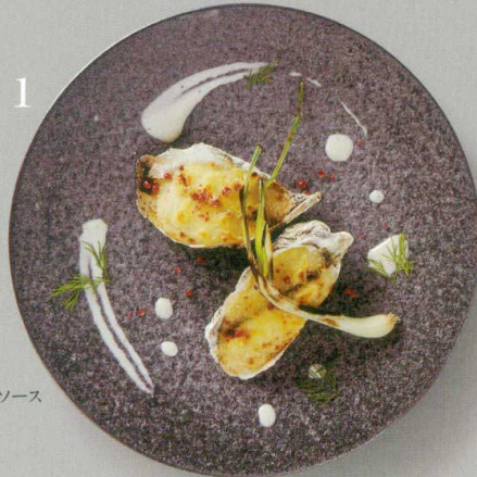
1 カキのオランダーズソース グラタン