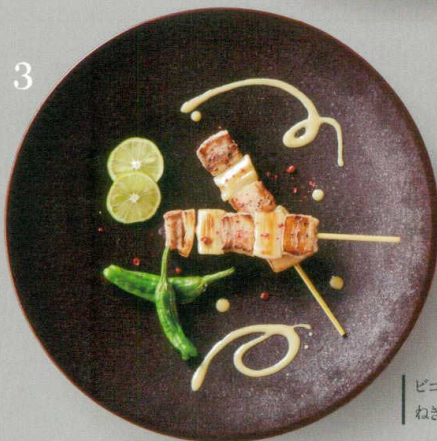
3 ピゴール豚の ねぎま仕立て