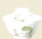
¥2,100 10-134-29-49030601 ¥1,200 ライス碗(小) 12.2×5.9・200cc 10-134-30-49090601 ¥900 蓋(小) 10.9×3.3