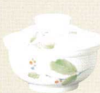
¥2,100 10-134-35-49060601 ¥1,200 多用碗(小) 12.2×5.9・250cc 10-134-36-49090601 ¥900 蓋(小) 10.9×3.3