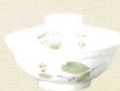
¥2,420 10-134-31-49040601 ¥1,370 多用碗(大) 14.8×6.1・300cc 10-134-32-49070601 ¥1,050 蓋(大) 13.1×3.6