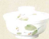
¥2,200 10-134-33-49050601 ¥1,200 多用碗(中) 13.6×6.1・300cc 10-134-34-49080601 ¥1,000 蓋(中) 12.2×3.3