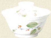
¥2,420 10-134-25-49010601 ¥1,370 ライス碗(大) 14.8×9.8・400cc 10-134-26-49070601 ¥1,050 蓋(大) 13.1×3.6