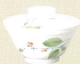
¥2,200 10-134-27-49020601 ¥1,200 ライス碗(中) 13.4×7・300cc 10-134-28-49080601 ¥1,000 蓋(中) 12.2×3.3