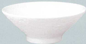
10-141-6-34680001 ¥2,150 25cm高台丼 25.2×9.5-1,800cc