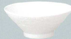
10-141-8-34665001 ¥880 20cm高台丼 19.5×7.5-990cc