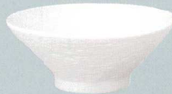
10-141-7-34670001 ¥1,080 21cm高台丼 21.4×9-1,200cc