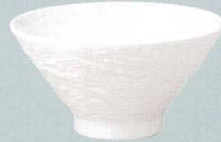
10-141-10-34660001 ¥1,050 18cm高台深口丼 18×9.6-950cc