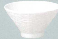
10-141-11-34655001 ¥830 16cm高台深口丼 16.5×8.6-720cc