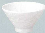
10-141-13-34645001 ¥620 14cm高台深口丼 13.6×7.5-515cc