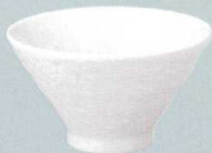
10-141-12-34650001 ¥730 15cm高台深口丼 14.6×8.2-520cc