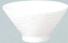
10-141-9-34663001 ¥1,210 19cm高台深口丼 19.3×10.1-1,150cc