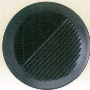
10-99-4-27226071 ¥4,200 26cm揚げ物皿 黒耀 26.2×2.8