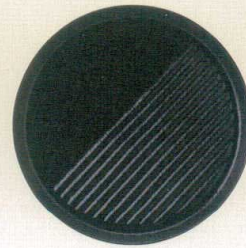
10-99-6-27222071 ¥1,150 22cm揚げ物皿 黒耀 22×2.2