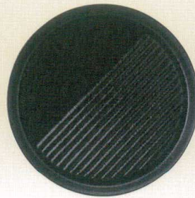
10-99-5-27225071 ¥1,850 25cm揚げ物皿 黒耀 25×2.3