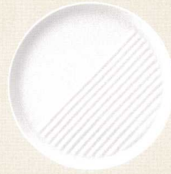
10-99-3-27222001 ¥1,050 22cm揚げ物皿 白 22×2.2