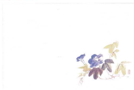
8 M30-209 朝顔 (6月～7月)