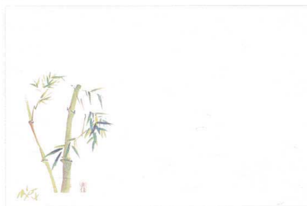
4 M30-206 竹 (4月～6月)