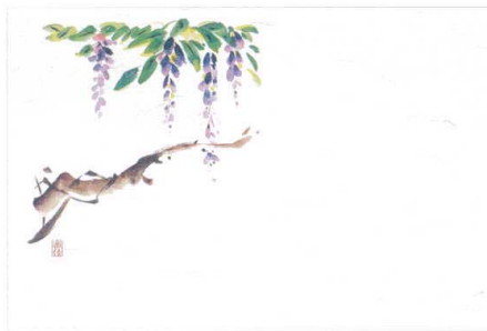
3 M30-291 藤 (4月～5月)