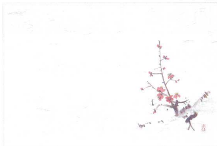
1 M30-204 梅 (2月～3月)

※季節に応じた絵柄ですので、在庫が切れる場合があります。 あらかじめご了承下さいませ。