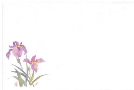
6 M30-207 あやめ (4月～5月)