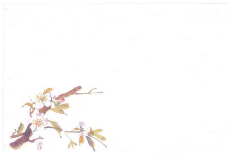
2 M30-205 桜 (3月～4月)