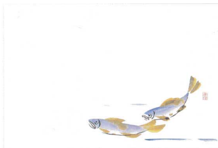
5 M30-293 あゆ (5月～6月)