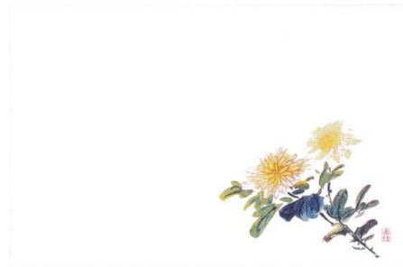
4 M30-294 菊(9月~10月)