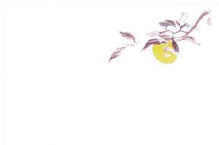
9 M30-215 ゆず(10月~12月)