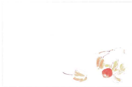
1 M30-210 ほおずき(7月~8月)