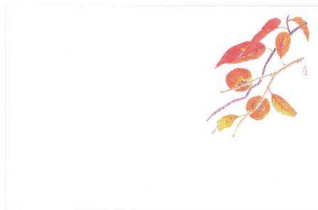
5 M30-211 柿(9月~10月)