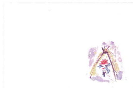
8 M30-255 寒牡丹(10月~12月)