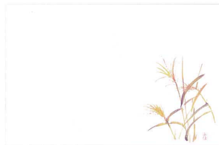
6 M30-214 すずき(9月~11月)