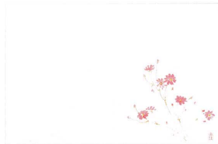
2 M30-212 秋桜(8月~9月)