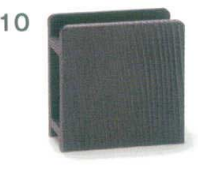
9 M44-116 1,870円 メニュー立て 黒 縦7.1×横11×高12