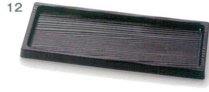
12 M44-127 2,300円 カスタートレー 黒 13.5×32 縦13.5×横32×高2.2(内寸縦11.5×横30×深1.5)