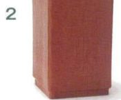
1 M44-128 1,950円 箸立て ライトブラウン 縦8.9×横8.9×高13.4(内寸縦7.4×横7.4×深1.2)