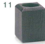
11 M44-118 920円 楊枝立て 黒 縦4.5×横4.5×高6(内寸φ3×深4.7)