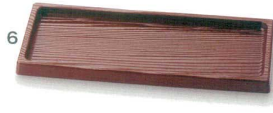
6 M44-140 2,300円 カスタートレー ブラウン 13.5×32 縦13.5×横32×高2.2(内寸縦11.5×横30×深1.5)