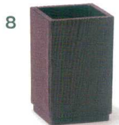
7 M44-115 2,550円 箸立て 黒 縦9×横9×高13.5(内寸縦7.4×横7.4×深1.2.1)