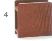
3 M44-129 1,380円 メニュー立て ライトブラウン 縦7×横10.9×高11.8