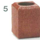
5 M44-131 800円 楊枝立て ライトブラウン 縦4.4×横4.4×高5.9(内寸φ2.9×深4.6)