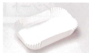
3 M34-114 13.5×18.5 1,500枚入 縦85×横135×高27