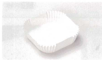
1 M34-112 14×14 1,500枚入 縦85×横85×高27