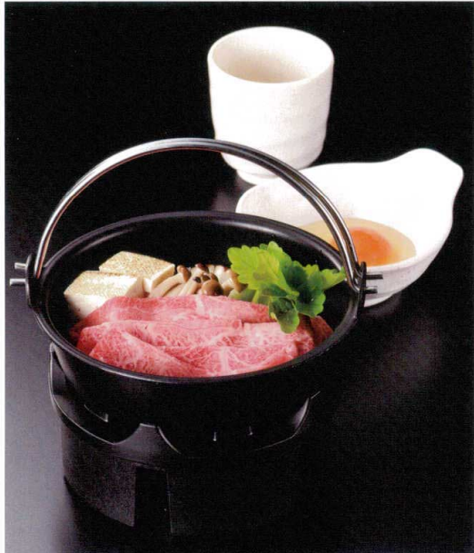
使用商品/黒鍋 φ17 ツル付 (M11-092)・グリルこんろ (M11-721)・火入れ(小)プレス (M10-913) ※こんろに仕様変更がございます。