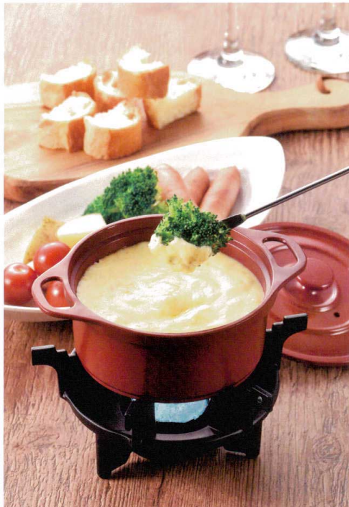
使用商品/ミニココ φ12 赤(アルミ) (M11-079)・花梨こんろ 6本ツメ五徳 (M11-317)