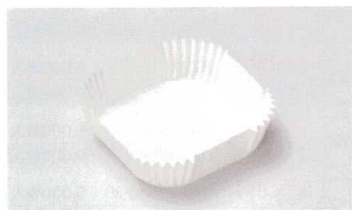
1 M34-112 14×14 1,500枚入 縦85×横85×高27