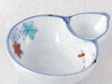
37K129-19 仕切鉢 1,300円 (13.2x11.1x3.8cm) 103826