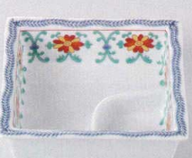
37K129-27 仕切鉢 820円 (11.1x3.4cm) 103788