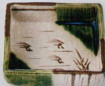
37E129-09 角鉢 2,900円 (11x11x3cm) 土物 710578