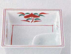
37K129-30 仕切鉢 680円 (11x3.3cm) 103785

和食 洋食 中鉢 小鉢 松花堂 小付 珍味 付出皿 前菜皿 焼酎皿 香水瓶 フルーツ皿 銘々皿 豆腐小皿 和皿 盛込皿 盛込鉢 煮物鉢 飯盛高内もて 湯呑 フリカケ まさ香 木下志野 瀾金 家徳 うた 井 掻鉢 プシ 中華