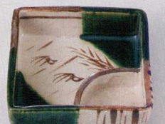
37E129-25 仕切鉢 3,800円 (11x11x3cm) 土物 710572