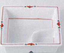
37M129-26 仕切鉢 770円 (11.3x3.3cm) 425051