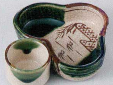
37E129-14 板型鉢 2,900円 (12x6.3x3cm) 土物 710576 37E129-15 丸千代口 1,450円 (5x3.5cm) 土物 710577