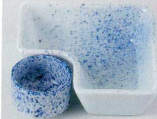
37K129-05 L型鉢 1,200円 (11.2x11.2x3.3cm) 103806 37K129-06 千代口 520円 (4.7x3.2cm) 103807