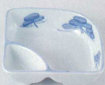
37K129-16 仕切鉢 1,150円 (11.2x11x3.7cm) 103830