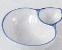
37A129-18 仕切鉢 820円 (12.6x11x3.7cm) 322918