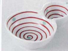
37Y129-03 仕切鉢 無鉛 1,250円 (13x9x3.3cm) 623116