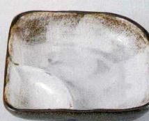
37E129-11 仕切鉢 1,500円 (11.5x11.5x3.4cm) 土物 711162