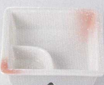
37M129-21 仕切鉢 580円 (11.5x3.5cm) 465008