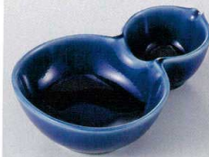
37H129-04 平鉢 890円 (13x8.9x3.5cm) 910063