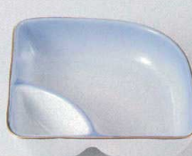
37K129-17 仕切鉢 1,250円 (11.2x11x3.7cm) 103831