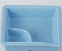
37M129-22 仕切鉢 620円 (11.5x3.3cm) 410250