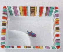
37K129-28 仕切鉢 860円 (11.2x3.5cm) 103664