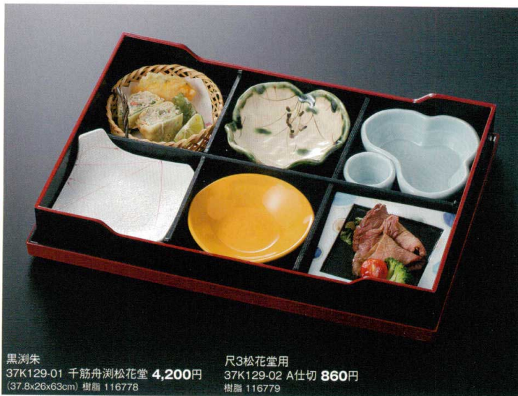
黒瀾朱 37K129-01 千筋舟瀾松花堂 4,200円 (37.8x26x63cm) 樹脂 116778 尺3松花堂用 37K129-02 A仕切 860円 樹脂 116779