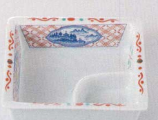
37K129-29 仕切鉢 680円 (11x3.3cm) 103784