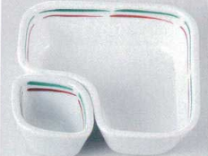
37K129-07 L型鉢 1,050円 (11.1x3.1cm) 103644 37K129-08 千代口 490円 (6x4.6x3.2cm) 103645