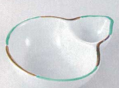
37K129-20 仕切鉢 1,600円 (13.2x11.1x3.8cm) 103827