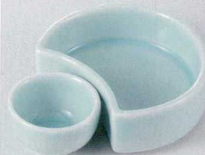
37M129-12 半月鉢 1,400円 (10x7.8x3.5cm) 425054 37M129-13 丸千代口 860円 (5.1x3.2cm) 425055