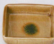
37E129-10 角鉢 2,900円 (11x11x3cm) 土物 711578