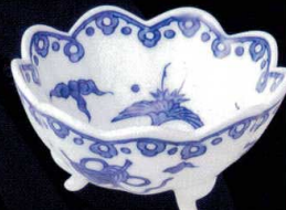
トルコ釉 双葉小鉢 上蓋 下蓋 37Q131-10 4,000円(12x8x5cm) 土物 203017

雲と鶴を組み合わせた優雅な文様は、平安時代から高貴な吉祥紋として用いられています。