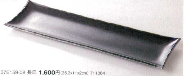
37E159-08 長皿 1,600円(35.3x11x2cm) 711364