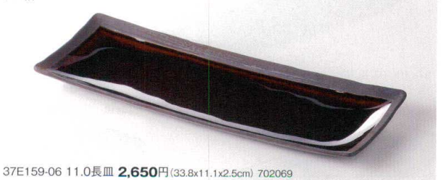
37E159-06 11.0長皿 2,650円(33.8x11.1x2.5cm) 702069