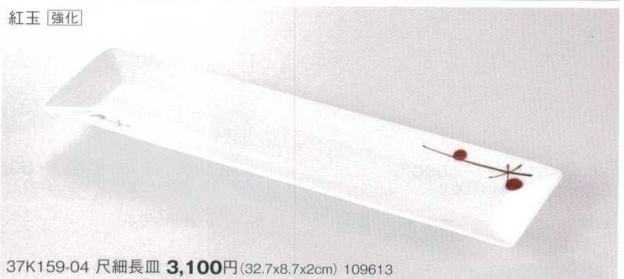
37K159-04 尺細長皿 3,100円(32.7x8.7x2cm) 109613