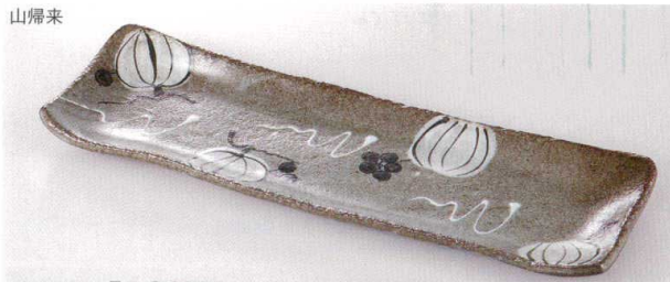
37E159-01 長皿 2,850円(34.5x10.8x2.5cm) 土物 711055