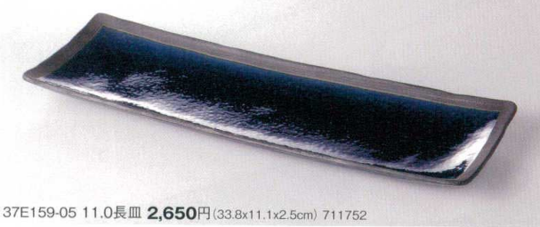
37E159-05 11.0長皿 2,650円(33.8x11.1x2.5cm) 711752