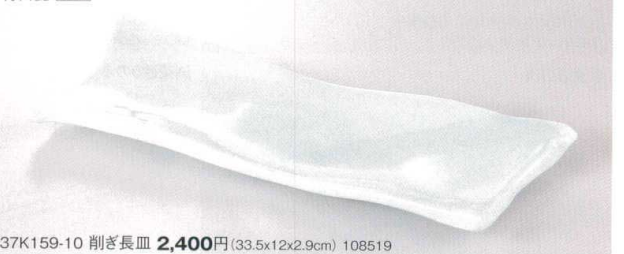
37K159-10 削ぎ長皿 2,400円(33.5x12x2.9cm) 108519