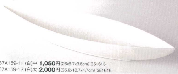
37A159-11 (白)中 1,050円(26x8.7x3.5cm) 351615 37A159-12 (白)大 2,000円(35.6x10.7x4.7cm) 351616