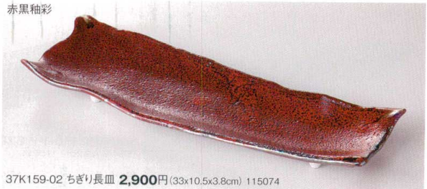
37K159-02 ちぎり長皿 2,900円(33x10.5x3.8cm) 115074