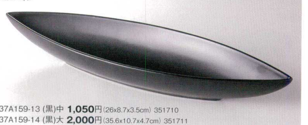
37A159-13 (黒)中 1,050円(26x8.7x3.5cm) 351710 37A159-14 (黒)大 2,000円(35.6x10.7x4.7cm) 351711

山帰来 あしゆら 紺結晶 ちぎり白 熔岩流 コンバイン 赤黒釉彩 紅玉 [強化] アメ釉 ちぎり黒 青白瓷 [強化] コンバイン