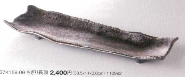
37K159-09 ちぎり長皿 2,400円(33.5x11x3.8cm) 110992