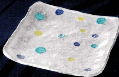
北大路角山人の器を写した美しい銀彩皿。 色鮮やかな三色の水玉が八寸のキャンパスに散りばめられ、 料理の盛付けを際立たせます。 銀彩水玉 24 角皿(無鉛) [上絵] [不可] 37Q165-03 21,000円(24.3x24.3x2.5cm) 土物 207086