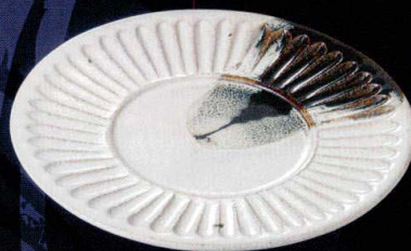
美濃焼では珍しい朝鮮唐津の八寸皿。 柔らかな白さの海鼠釉に黒鉛釉を掛け流した斬新なコントラスト。 波ぎの力強さも魅力の逸品です。 朝鮮唐津し のぎ前菜皿 37Q165-06 10,000円(25.3x26cm) 土物 207087