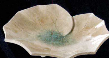
古来より日本人は自然の葉っぱを器としてきました。 灰釉とエメラルド色のコントラストが美しい、 葉型の盛り皿で多彩な演出をお楽しみください。 灰釉葉型 盛皿 37Q165-09 11,000円(23.8x22.4x3.6cm) 土物 207064