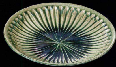
細やかに力強く、 放射状に彫り込まれた造形が美しい前菜皿。 織部釉の濃淡が味わい深さを感じさせてくれます。 織部し のぎ85皿 37Q165-07 11,000円(25.3x4cm) 土物 207089