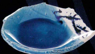
地中海や南の島をイメージさせる コバルトブルーの海と白い砂。 浜風の色の対比が美しい、清涼感あふれる一枚。 ブルー釉(知山クラフト) 変形向付 37K165-08 8,900円(22x19.5x4.4cm) 土物 100015