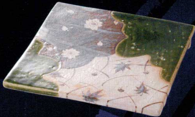
桜と紅葉を織部の意匠で正角皿に仕上げました。 季節を問わず八寸皿として多用途に活躍してくれそうです。 織部春秋(玉山窯) 角皿(小) 37K165-01 8,500円(18x26cm) 土物 115981 織部春秋(玉山窯) 角皿(大) 37K165-02 16,000円(23.8x22cm) 土物 115982