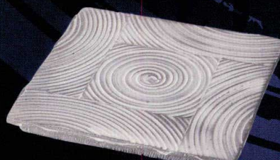
幾何学文様にも似た丸紋を、刷毛で描いたモダンな器。 味わい深い、正角皿は盛り付けの 創造力を掻き立てます。 窯変刷毛目 正角皿 37Q165-12 11,000円(21.7x19cm) 土物 212088