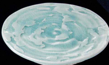
大海原を想わせる美しい青磁の透明感。 爽やかに大胆な開りで魅せる表情は、海の幸を盛り付けるのに 最適な逸品です。 青磁荒磯 盛皿 [画入] 37Q165-11 16,000円(26.5x3.2cm) 土物 207085