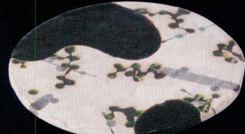
黒織部のまな板皿同様のコントラスト模様を施した、 使いやすい丸型の前菜皿。白黒の色合いと凝った模様が 前衛的な料理にも使いこなせそうです。 黒織部草紋(玉山窯) 丸前菜皿 37K165-10 9,600円(22.5x2.3cm) 土物 114169