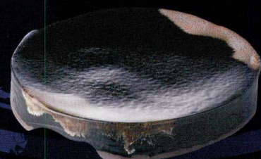
高台の作用になっていますが、 中心に向けて適度な窪みが多用途な盛り付けに 好ましいです。 備前かこの高台変型盛皿 37A165-13 12,000円(28.8x27x4.2cm) 土物 315722