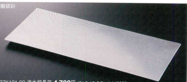
37K191-02 流水細長皿 4,700円 (31.8x13x0.7cm) 118032