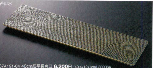
37A191-04 40cm細平長角皿 6,200円 (40.4x12x1cm) 300064