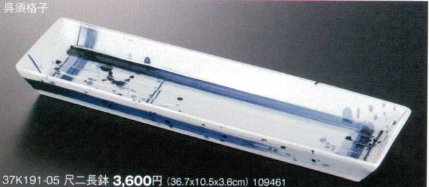
37K191-05 尺二長鉢 3,600円 (36.7x10.5x3.6cm) 109461