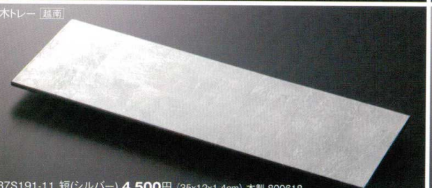
37S191-11 短(シルバー) 4,500円 (35x12x1.4cm) 木製 800618