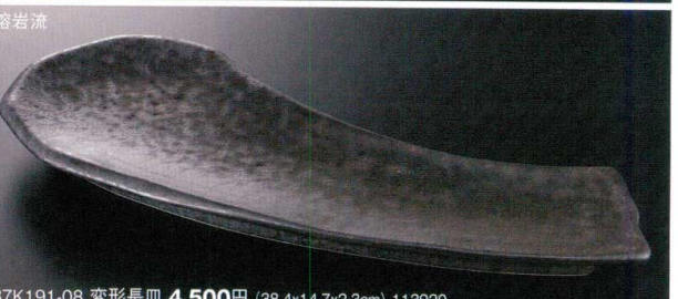
37K191-08 変形長皿 4,500円 (38.4x14.7x2.3cm) 113920