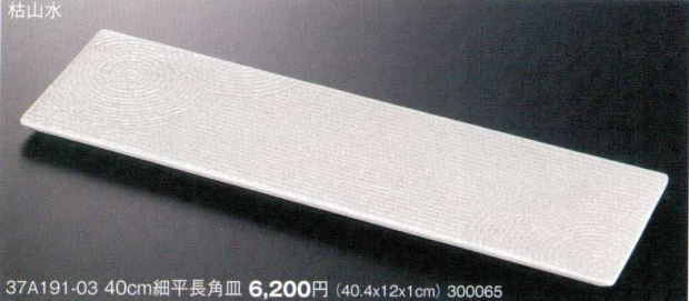
37A191-03 40cm細平長角皿 6,200円 (40.4x12x1cm) 300065