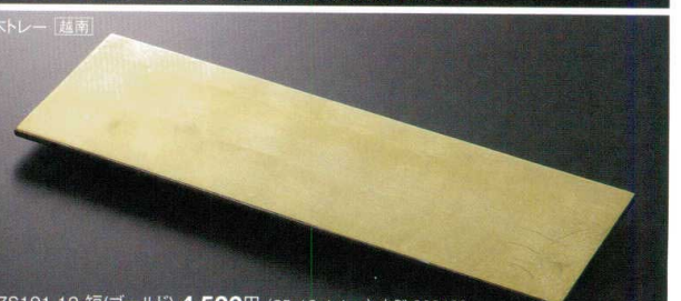
37S191-12 短(ゴールド) 4,500円 (35x12x1.4cm) 木製 800482