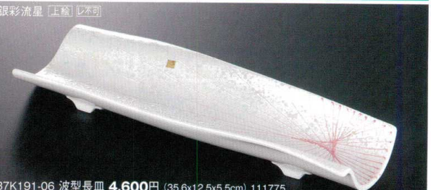
37K191-06 波型長皿 4,600円 (35.6x12.5x5.5cm) 111775