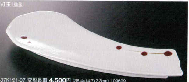
37K191-07 変形長皿 4,500円 (38.4x14.7x2.3cm) 109609