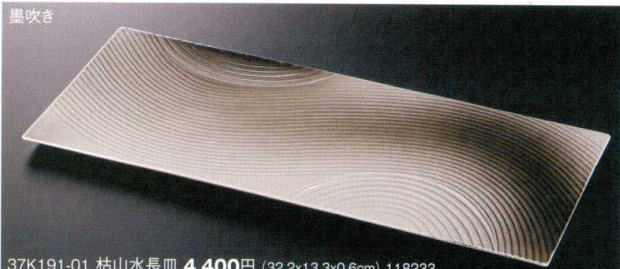
37K191-01 枯山水長皿 4,400円 (32.2x13.3x0.6cm) 118233