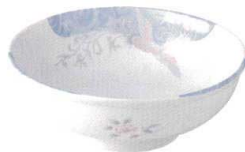
37K356-30 湯呑 890円 (9.5x5.5cm) 112602