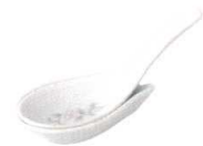
37K356-32 レンゲ台 480円 (9.5x5.5cm) 112611