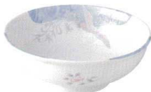
37K356-28 7.0玉井 3,700円 (21.5x7.9cm) 112608