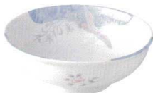
37K356-27 6.5玉井 2,700円 (19.8x7.5cm) 112607