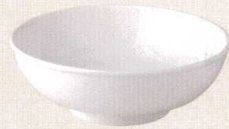
37K363-42 7.0玉井 3,600円 (21.4x7.7cm) 108090 37K363-43 8.0玉井 6,300円 (24.7x8.7cm) 108091 37K363-44 9.0玉井 11,000円 (28.7x9.5cm) 108092