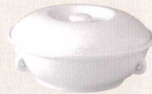
37K363-50 10吋トンキ 16,500円 (26x12cm) 110861 A:蓋 6,500円 B:身 10,000円