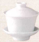
37K363-53 茶壺 1,800円 (9.2x8.5cm) 110868 A:蓋 840円 B:身 960円 37K363-54 台皿 850円 (9x2.8cm) 110869