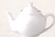
37K363-56 丸土瓶 7,700円 (22.9x14x14.7cm) 110867