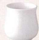
37K363-70 ガラ入(小) 2,900円 (10.2x9.8cm) 108098