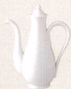
37K363-57 老酒ポット 6,300円 (15.3x7.8x19.2cm) 110862 A:蓋 2,500円 B:身 3,800円