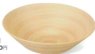
金彩オレンジ巻 [上絵] [不可] 37K039-24 7.0鉢 4,800円 (21.3x6.4cm) 100207