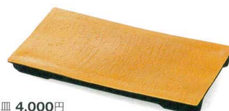
金彩 [上絵] 37M039-25 まな板皿 4,000円 (24.8x12.7x2.7cm) 419149