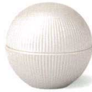
銀彩彫 [上絵] [不可] 37Q039-02 丸型蓋物 5,400円 (9.5x9.2cm) 214046 A:蓋 2,700円 B:身 2,700円