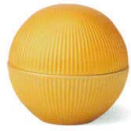
金彩彫 [上絵] [不可] 37Q039-01 丸型蓋物 5,400円 (9.5x9.2cm) 214045 A:蓋 2,700円 B:身 2,700円