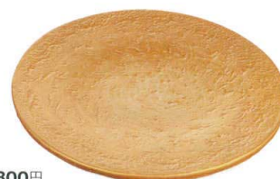
黄金石 [上絵] [不可] 37K039-27 砂目8寸皿 7,300円 (23.7x2.2cm) 114798