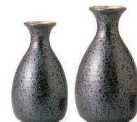
金マット [不可] 37F039-14 一合徳利 2,400円 (6.7x11.8cm 160cc) 523740 37F039-15 二合徳利 2,600円 (7.6x14.5cm 300cc) 523739