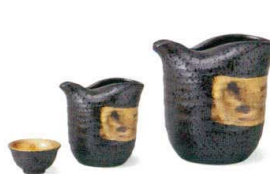
黒結晶金刺し 37F039-11 平盃 1,550円 (6.3x3.3cm 50cc) 500326 黒結晶金巻 37F039-12 冷酒器小 3,500円 (9.6x7.3x8.5cm 200cc) 500315 37F039-13 冷酒器大 4,000円 (11.2x8.5x10.8cm 400cc) 500314