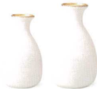
白粉引金刺し 37F039-09 一合徳利 2,400円 (6.7x11.8cm 160cc) 500320 37F039-10 二合徳利 2,600円 (7.6x14.5cm 300cc) 500319