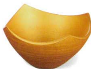
パール金 [上絵] 37H039-19 四方鉢 3,600円 (13x7.5cm) 911111