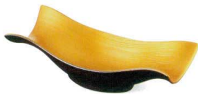
アメ釉内金 [上絵] [不可] 37Q039-16 くびれ向付 3,400円 (21.3x9.3x6cm) 201131