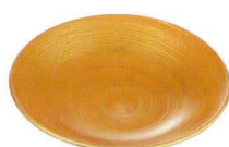
茶金彩 [上絵] [不可] 37H039-20 4.0平皿 1,550円 (13.9x3cm) 911159