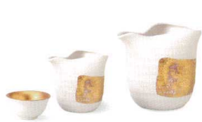
白粉引口金刺し 37F039-06 平ぐい呑 1,480円 (6.3x3.3cm 50cc) 500313 白粉引金巻 37F039-07 冷酒器小 3,500円 (9.6x7.3x8.5cm 200cc) 500312 37F039-08 冷酒器大 4,000円 (11.2x8.5x10.8cm 400cc) 500311