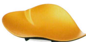
金彩 [上絵] [不可] 37Q039-17 山型向付 4,400円 (22.5x13.5x5.7cm) 201129