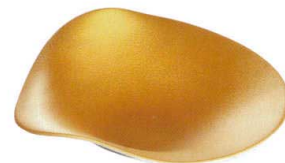
ゴールドウェーブ [上絵] [不可] 37K039-18 7寸向付 4,100円 (21x6.7cm) 116606