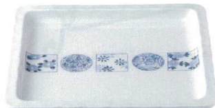
染付小紋 37K414-01 2/3フードパン(浅) 15,000円 (35x32.2x3.6cm) 117754