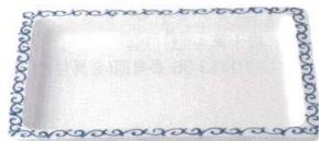
青唐草 37K414-02 1/2フードパン(浅) 12,000円 (32.1x25.7x3.6cm) 117753