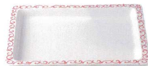
赤唐草 37K414-05 1/2フードパン(浅) 12,000円 (32.1x25.7x3.6cm) 117752