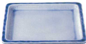
青流し 37K414-04 2/3フードパン(浅) 18,000円 (35x32.2x3.6cm) 117755