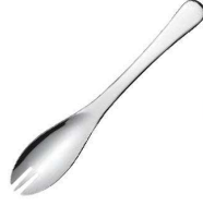
②18-0 スリム どんぶりすプーン (ふおーく付)