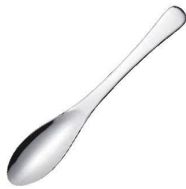
①18-0 スリム どんぶりすプーン