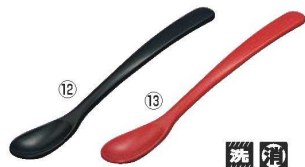
メラミン スプーン 小