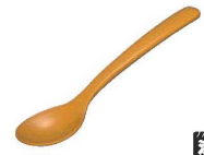
⑪メラミン スプーン