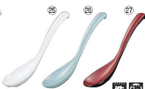
メラミン チリレンゲ M-590