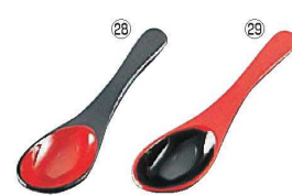
和風塗り レンゲスプーン