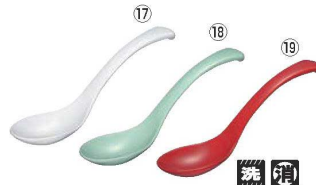
メラミン ユニレンゲ L5