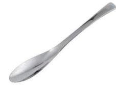
③18-8 スマートスプーン