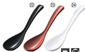
メラミン ビタれんげ 57-5