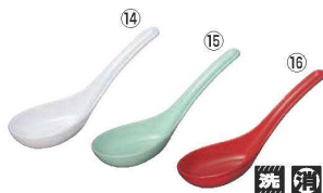
メラミン 七八レンゲ L3