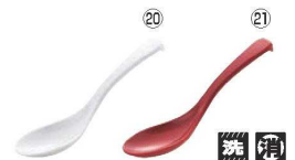
メラミン ユニレンゲ L6