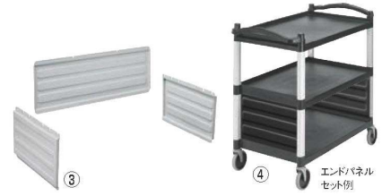
KDユーティリティカート用 シェルフパネルセット BC340KDP

外寸:1,015×540×H950 キャスター:φ125(自在×4・ストッパー無) 有効棚サイズ:800×520 有効棚間口:298 耐荷重:180kg 材質:棚部/ポリプロピレン 支柱/アルミニウム ●組立時にシングルハンドル、ダブルハンドルを設定できます。 ●作業のしやすいように片側には立ち上がりがあります。