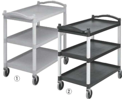
KDユーティリティカート BC340KD