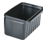
⑦ KDカート用シルバーウェア ホルダー BC331KDSH

外寸:835×410×H965 内寸:620×400×H300 キャスター:φ100(自在4輪(ストッパー無し)) 棚間隔:300 耐荷重:136kg 材質:棚部/ポリプロピレン 支柱/アルミ ●組立時にシングルハンドル、ダブルハンドルを設定できます。 ●作業のしやすいように片側には立ち上がりがあります。