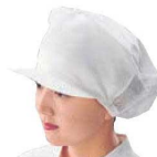
⑮抗菌帽子 女子用 SW 83-1