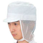
⑯フードキャップ D型 SK 7502

材質:ポリエステル85%、綿15%、ポリアクリル フリーサイズ・ツバ、細メッシュ付