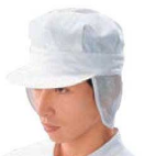
⑭抗菌帽子 男子用 SW 84-1

材質:ポリエステル65%・綿35% 頭回り:M/58cm L/61cm ※色落ちする事がありますので他の物と一緒に洗わないでください。