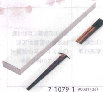
7-1079-1 (90031426) ¥100 販促用 白ボール箱 (一膳) 紙 242×42×14