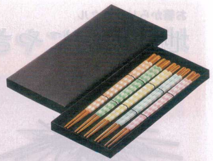
7-1079-6 (90033378) ¥850 箸ボックス (五膳) 黒 紙 250×115×19