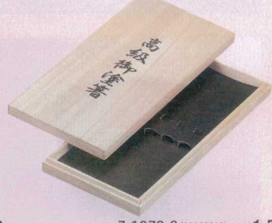
7-1079-9 (90023210) ¥1,500 桐箱 (表書有) 五膳用台紙付 木 270×130×20