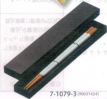
7-1079-3 (90031424) ¥600 箸ボックス (一膳) 黒 紙 250×40×19