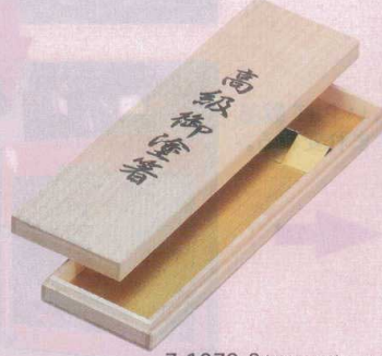
7-1079-8 (90023200) ¥1,200 桐箱 (表書有) 二膳用台紙付 木 270×80×20