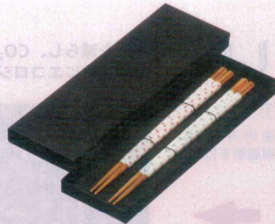
7-1079-5 (90031425) ¥750 箸ボックス (二膳) 黒 紙 250×80×19