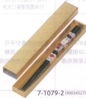
7-1079-2 (90034527) ¥450 箸ボックス (一膳用) 金 紙 242×37×19