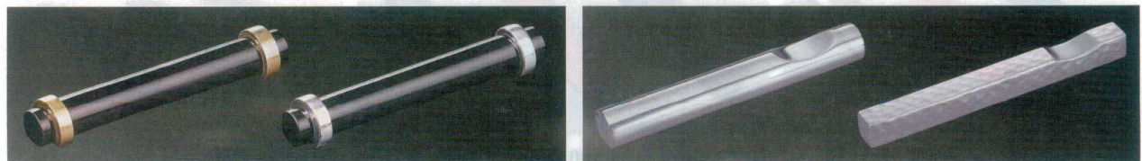
7-1083-19 (90022825) ¥2,100 枕型ナイフレスト M ゴールドリング 95×18 7-1083-20 (90022826) ¥2,100 枕型ナイフレスト M シルバーリング 95×18 7-1083-21 (90022827) ¥2,750 枕型箸置付ナイフレスト ST シルバー 110×15 7-1083-22 (90022828) ¥2,750 角型箸置付ナイフレスト ST シルバー 100×10