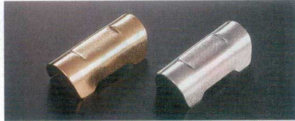
7-1083-1 (12018340) ¥1,400 ドーム型箸置 ST ゴールド 45×22×14 7-1083-2 (12018350) ¥1,200 ドーム型箸置 ST シルバー 45×22×14