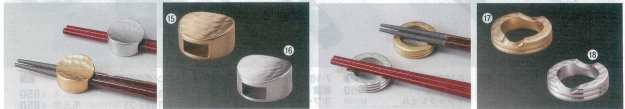
7-1083-15 (81017790) ¥2,500 かんざし箸止め兼箸置 ST ゴールド φ25×11 7-1083-16 (81017810) ¥2,500 かんざし箸止め兼箸置 ST シルバー φ25×11 7-1083-17 (81017820) ¥2,750 三輪箸置 ST ゴールド φ31×8 7-1083-18 (81017830) ¥2,750 三輪箸置 ST シルバー φ31×8