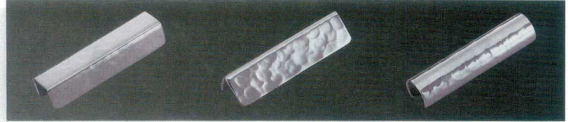
7-1083-3 (90022823) ¥1,200 箱型箸置 ST ディンプルシルバー 60×16 7-1083-4 (90022822) ¥1,400 三角箸置 ST ディンプルシルバー 60×18 7-1083-5 (90022824) ¥1,950 丸型箸置 ST ディンプルシルバー 60×15