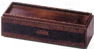
7-1120-1 (85914810) ¥14,000 荒彫カスター&箸箱(楊枝入れ付) 木 柄 280×100×85