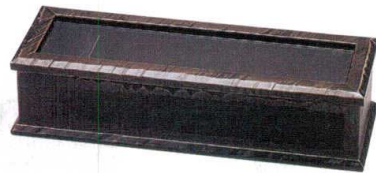
7-1120-8 (85914800) ¥13,000 荒彫箸箱 よもぎ 木 285×100×70