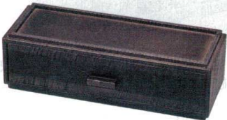
7-1120-2 (85914820) ¥14,000 荒彫カスター&箸箱(楊枝入れ付) 木 よもぎ 280×100×85