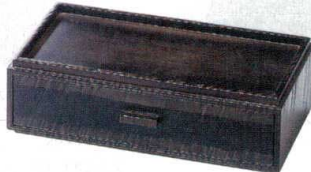
7-1120-4 (85914840) ¥14,500 奥広荒彫カスター&箸箱 木 よもぎ 280×145×85