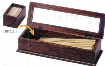
7-1120-9 (75002455) ¥10,000 箸箱(楊枝入付) 摺漆塗 木 摺漆 310×107×76

楊枝入れをセットしても23cmの箸が入ります。 楊枝入れをはずすと26cmの箸が入ります。