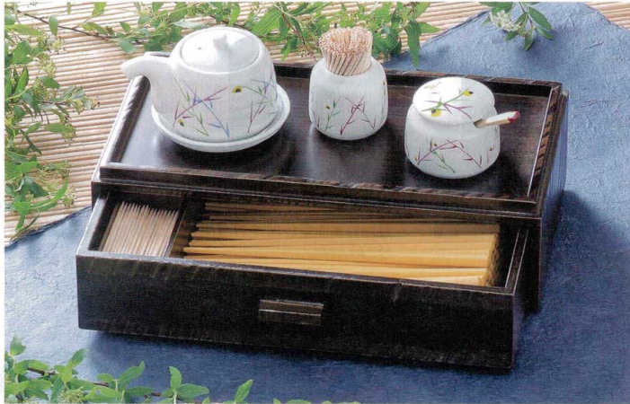
カスター&箸箱 取りはずし楊枝入付