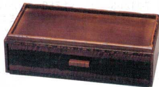
7-1120-3 (85914830) ¥14,500 奥広荒彫カスター&箸箱 木 柄 280×145×85