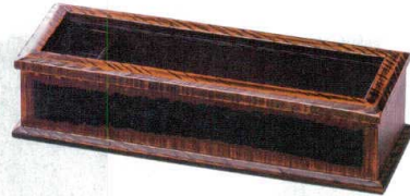
7-1120-7 (85914790) ¥13,000 荒彫箸箱 柄 木 285×100×70