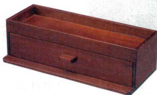
7-1120-6 (60003490) ¥16,000 カスター&箸箱 木 ブラウン 270×120×80