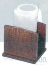
7-1123-25 (85914320) ¥5,500 木 荒彫ナプキン立て 柘 100×65×95