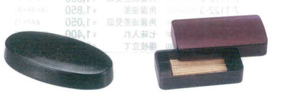
7-1123-14 (75002290) ¥1,400 7-1123-15 (75002260) ¥2,250 富士小判楊枝入れ 黒パール A 箱型楊枝入れ 溜 木製 105×55×20 φ101×57