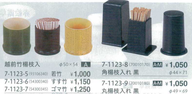
越前竹楊枝入 φ50×54 A 7-1123-8 (70010170) AM ¥1,050 7-1123-5 (93106340) 若竹 ¥1,000 角楊枝入れ黒 φ44×71 7-1123-6 (54300340) すす竹 ¥1,150 7-1123-9 (70010180) AM ¥1,050 7-1123-7 (54300345) ゴマ竹 ¥1,250 丸楊枝入れ黒 φ49×69