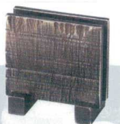
7-1123-24 (85914900) ¥5,250 木 荒彫メニュー立て よもぎ 100×60×100