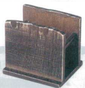
7-1123-23 (85914310) ¥5,500 木 荒彫ナプキン立て よもぎ 100×65×95