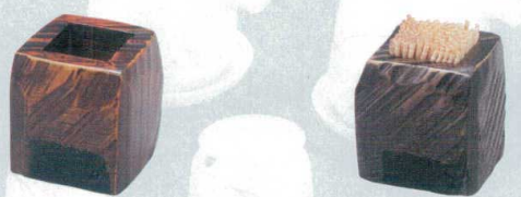
7-1123-16 (85915000) ¥3,300 7-1123-17 (85915010) ¥3,300 5.5cm角荒彫楊枝立て 柘 木 5.5cm角荒彫楊枝立て よもぎ 木 φ55×55 φ55×55