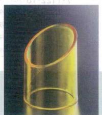
7-1123-21 (81258293) ¥750 AC 伝票立て イエロー φ52×70