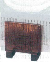
7-1123-26 (85914890) ¥5,250 木 荒彫メニュー立て 柘 100×60×100

樹脂箸 木製箸 ステンレス箸 ギフト用品 箸置き スプーン カトラリー ストロー 卓上備品 卓上小物