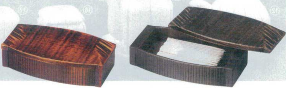
7-1123-18 (85914945) ¥5,000 7-1123-19 (85914950) ¥5,250 荒彫小判楊枝入れ 柘 木 荒彫小判楊枝入れ よもぎ 木 105×60×25 105×60×25