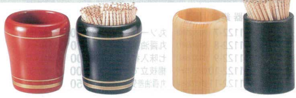
まゆ型楊枝入 φ51×57 A 丸楊枝入 A 7-1123-10 (82155010) 朱に金ライン ¥1,200 7-1123-12 (82812480) 桜 ¥1,800 φ40×53 7-1123-11 (82155020) 黒に金ライン ¥1,200 7-1123-13 (82812500) ブラック ¥2,000 φ41×59