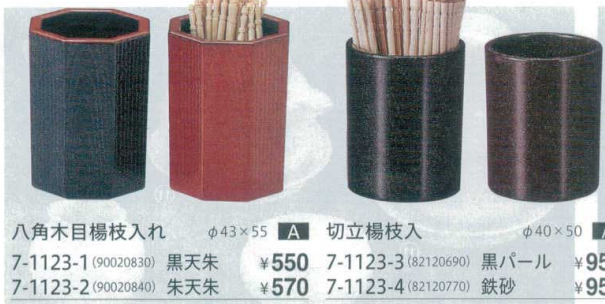
八角木目楊枝入れ φ43×55 A 切立楊枝入れ φ40×50 A 7-1123-1 (90020830) 黒天朱 ¥550 7-1123-3 (82120690) 黒パール ¥950 7-1123-2 (90020840) 朱天朱 ¥570 7-1123-4 (82120770) 鉄砂 ¥950