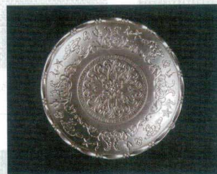
7-1129-3 (80602870) ¥1,400 メタルコースター丸菊花 ZNI シルバー φ94×10