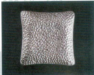
7-1129-1 (80602820) ¥1,400 メタルコースター角打目 ZNI シルバー 76×76×8