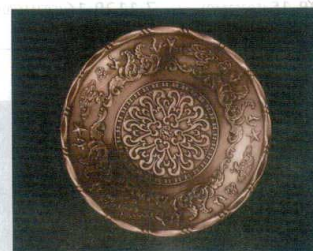
7-1129-6 (80602880) ¥1,500 メタルコースター丸菊花 ZNI ブロンズ φ94×10