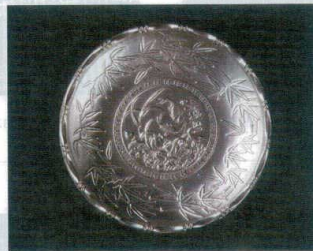
7-1129-4 (80602890) ¥1,400 メタルコースター丸笹 ZNI シルバー φ94×10