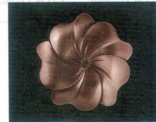
7-1129-8 (80602860) ¥1,650 メタルコースターフラワー ZNI ブロンズ φ90×10