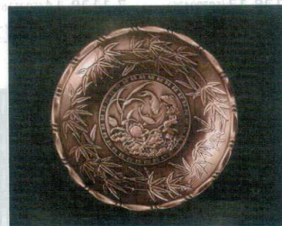
7-1129-7 (80602900) ¥1,500 メタルコースター丸笹 ZNI ブロンズ φ94×10