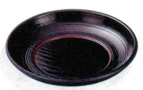
7-1132-7 (81016280) ¥850 3.6寸日の出茶托 M 黒内朱ライン 112×109×20