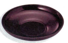
7-1132-10 (90072965) ¥850 3.6寸ダルマ茶托 M 溜 φ108×20