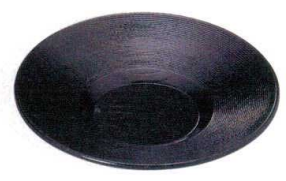
千筋茶托 黒 A 7-1132-13 (75000100) 3.5寸 ¥620 φ103×18 7-1132-14 (75000110) 4寸 ¥650 φ118×18