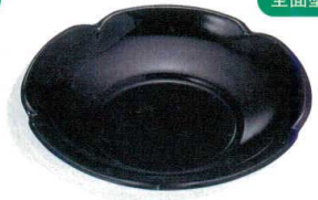
7-1132-12 (90042960) ¥900 3.6寸梅無地茶托 M 黒 φ108×19