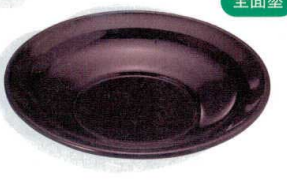
7-1132-22 (75000440) ¥1,200 4寸越路茶托 木質 溜 120×121×20