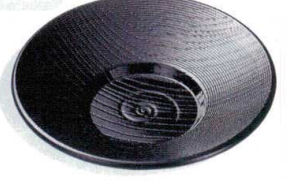
千筋木目渦茶托 黒 A 7-1132-17 (81015300) 3.8寸 ¥700 φ114×19 7-1132-18 (81015310) 4寸 ¥700 φ120×20