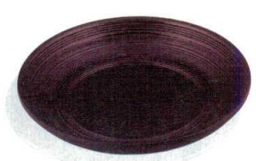
7-1132-8 (85915500) ¥850 3.6寸日の出茶托 M 溜 112×109×20