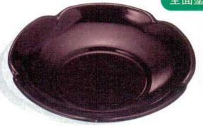
7-1132-11 (75000190) ¥950 3.6寸梅無地茶托 M 溜 φ108×19