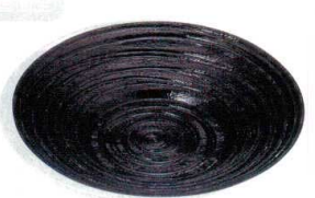
7-1132-3 (75000170) ¥850 3.6寸宴乱筋茶托 M 黒 φ107×20