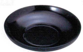
7-1132-1 (75000350) ¥850 2.8寸ダルマ茶托 木質 黒 φ84×18