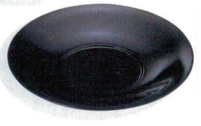
7-1132-23 (75000290) ¥950 4寸ユリ型茶托 木質 黒 φ121×18