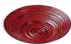
7-1132-4 (75000180) ¥1,000 3.6寸宴乱筋茶托 M 根来 φ107×20