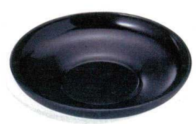
7-1132-9 (75000240) ¥750 3.6寸ダルマ茶托 M 黒 φ108×20