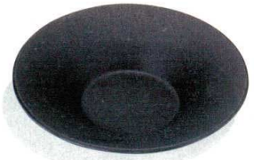
7-1132-5 (75000190) ¥800 3.6寸朝顔茶托 M 黒干漆 φ109×19