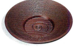
千筋木目渦茶托 ケヤキ A 7-1132-19 (82154510) 3.8寸 ¥900 φ114×19 7-1132-20 (82154520) 4寸 ¥900 φ120×20