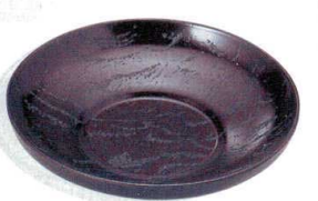
7-1132-2 (75000340) ¥1,250 2.8寸ダルマ茶托 木質 漆刻木目 φ84×18