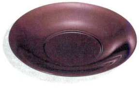
7-1132-24 (75000300) ¥1,150 4寸ユリ型茶托 木質 溜 121×118×18