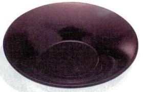
7-1132-6 (75000200) ¥850 3.6寸朝顔茶托 M 溜 φ109×19