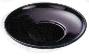
7-1132-21 (75000450) ¥650 4寸ダルマ茶托 A 黒干漆 120×121×20