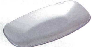
7-1138-12 (75004870) ¥1,400 会席おしぼり受 A シルバー 154×82×15