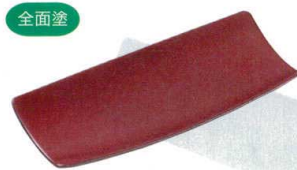
7-1138-13 (81016190) ¥1,400 時代おしぼり受け 木質 吟朱裏黒 179×81×16