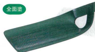
7-1138-6 (75001040) ¥1,450 笹舟おしぼり受け A 総グリーン 200×82×55