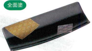
7-1138-16 (82015030) ¥1,950 時代おしぼり受け 木質 黒色紙裏黒 179×81×16