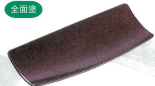
7-1138-14 (75001130) ¥1,400 時代おしぼり受け 木質 総新溜 179×81×16