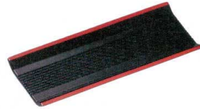
7-1138-3 (81016140) ¥1,000 筋入羽反おしぼり受け M 黒天朱 183×73×10