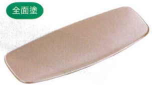
7-1138-20 (81016180) ¥1,950 布袋おしぼり受け 木質 銀塗裏黒 185×87×18