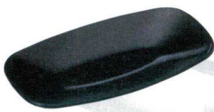
7-1138-9 (50303600) ¥900 会席おしぼり受 A 総黒乾漆 154×82×15