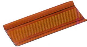
7-1138-4 (81016150) ¥1,550 筋入羽反おしぼり受け M 漆調春慶塗 183×73×10