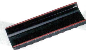
7-1138-7 (82016450) ¥1,400 DX亀甲おしぼり受け M 黒天朱 177×73×20