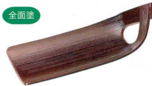
7-1138-5 (82036310) ¥1,200 笹舟おしぼり受け A 総溜 200×82×55