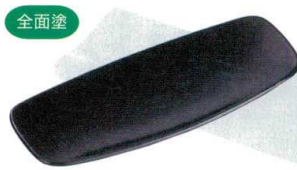
7-1138-17 (81016160) ¥1,550 布袋おしぼり受け 木質 総黒 185×87×18