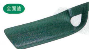
7-1138-6 (75001040) ¥1,450 笹舟おしぼり受け A 総グリーン 200×82×55