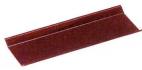
7-1138-2 (82155740) ¥700 羽反おしぼり受け A 溜 183×74×11