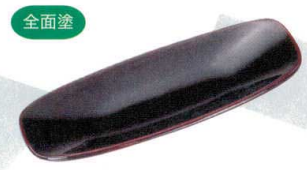
7-1138-18 (82146400) ¥1,800 布袋おしぼり受け 木質 漆調溜 185×87×18