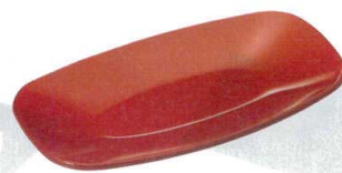
7-1138-10 (50303580) ¥900 会席おしぼり受 A 総柿朱 154×82×15