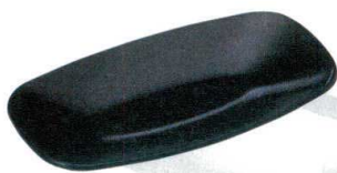
7-1138-9 (50303600) ¥900 会席おしぼり受 A 総黒乾漆 154×82×15