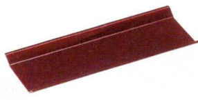
7-1138-2 (82155740) ¥700 羽反おしぼり受け A 溜 183×74×11