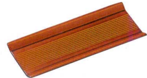
7-1138-4 (81016150) ¥1,550 筋入羽反おしぼり受け M 漆調春慶塗 183×73×10