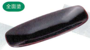
7-1138-18 (82146400) ¥1,800 布袋おしぼり受け 木質 漆調溜 185×87×18