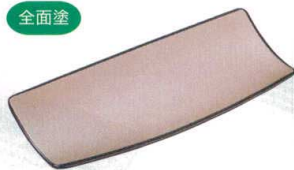
7-1138-15 (81016200) ¥1,650 時代おしぼり受け 木質 銀裏黒 179×81×16