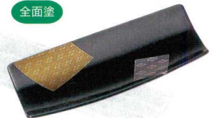
7-1138-16 (82015030) ¥1,950 時代おしぼり受け 木質 黒色紙裏黒 179×81×16