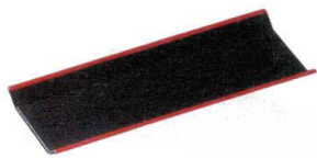
7-1138-1 (81016040) ¥520 羽反おしぼり受け A 黒天朱 183×74×11