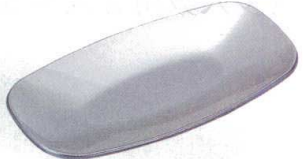
7-1138-12 (75004870) ¥1,400 会席おしぼり受 A シルバー 154×82×15