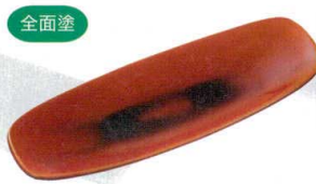
7-1138-19 (81016170) ¥2,000 布袋おしぼり受け 木質 漆調春慶塗裏黒 185×87×18