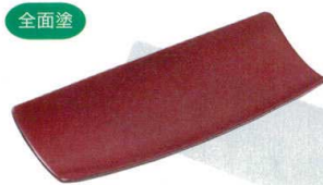
7-1138-13 (81016190) ¥1,400 時代おしぼり受け 木質 吟朱裏黒 179×81×16