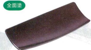
7-1138-14 (75001130) ¥1,400 時代おしぼり受け 木質 総新溜 179×81×16