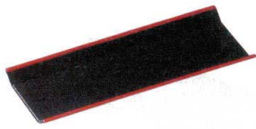
7-1138-1 (81016040) ¥520 羽反おしぼり受け A 黒天朱 183×74×11