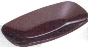
7-1138-11 (50303590) ¥950 会席おしぼり受 A 総溜 154×82×15