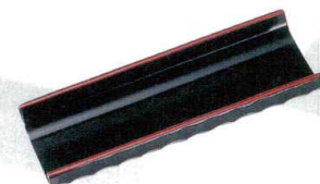
7-1138-7 (82016450) ¥1,400 DX亀甲おしぼり受け M 黒天朱 177×73×20