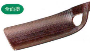
7-1138-5 (82036310) ¥1,200 笹舟おしぼり受け A 総溜 200×82×55