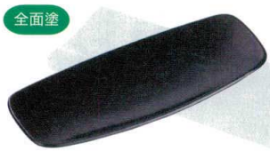
7-1138-17 (81016160) ¥1,550 布袋おしぼり受け 木質 総黒 185×87×18