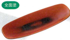
7-1138-19 (81016170) ¥2,000 布袋おしぼり受け 木質 漆調春慶塗裏黒 185×87×18