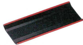
7-1138-3 (81016140) ¥1,000 筋入羽反おしぼり受け M 黒天朱 183×73×10