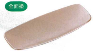
7-1138-20 (81016180) ¥1,950 布袋おしぼり受け 木質 銀塗裏黒 185×87×18