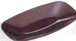
7-1138-11 (50303590) ¥950 会席おしぼり受 A 総溜 154×82×15