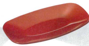
7-1138-10 (50303580) ¥900 会席おしぼり受 A 総柿朱 154×82×15