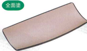
7-1138-15 (81016200) ¥1,650 時代おしぼり受け 木質 銀裏黒 179×81×16