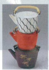
加賀土瓶 茶こし 7-1143-3 (90020860) 小 ¥380 7-1143-4 (90020870) 大 ¥430