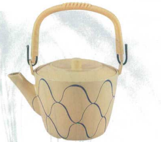
加賀土瓶セット 網目 TA 7-1143-11 (90020230) 小 (650cc) ¥6,050 φ125×200 7-1143-12 (90020240) 大 (900cc) ¥7,500 φ140×230