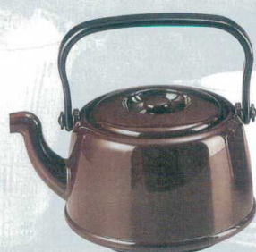
やすらぎ土瓶 茶こしセット 溜 A 7-1143-17 (81015655) 小 (1.0ℓ) ¥7,000 192×155×113 7-1143-18 (81212916) 大 (1.8ℓ) ¥8,600 237×184×131