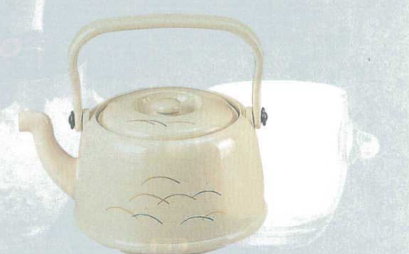
やすらぎ土瓶 茶こしセット アイボリーつゆ草 A 7-1143-19 (81212821) 小 (1.0ℓ) ¥7,500 192×155×113 7-1143-20 (81212921) 大 (1.8ℓ) ¥9,000 237×184×131