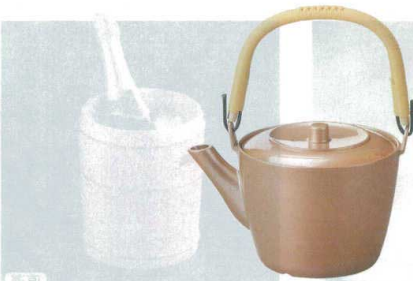
加賀土瓶 銀透べつ甲セット TA 7-1143-9 (81017050) 小 (650cc) ¥5,850 φ125×200 7-1143-10 (81017060) 大 (900cc) ¥7,000 φ140×230