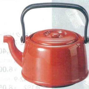
やすらぎ土瓶 茶こしセット 朱 A 7-1143-13 (81283431) 小 (1.0ℓ) ¥6,700 192×155×113 7-1143-14 (81283441) 大 (1.8ℓ) ¥8,000 237×184×131