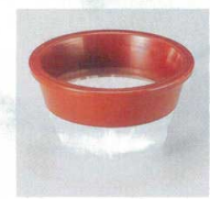
やすらぎ土瓶用 茶こし PP 7-1143-15 (81212800) 小 ¥900 7-1143-16 (81212805) 大 ¥900