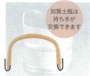
加賀土瓶 持ち手 7-1143-5 (90020880) 小 ¥650 7-1143-6 (90020890) 大 ¥750