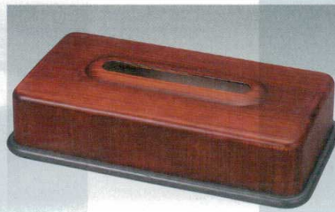
7-1155-10 (51365290) ¥5,000 浅型ティッシュBOX A PE チーク木目 (底ラバー) 269×139×69