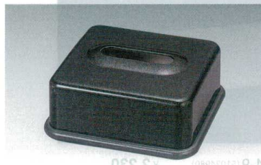
7-1155-6 (51365240) ¥2,550 ハーフティッシュBOX A PE 黒銀パール (底ラバー) 148×139×69