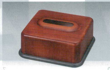
7-1155-7 (51365280) ¥3,150 ハーフティッシュBOX A PE チーク木目 (底ラバー) 148×139×69