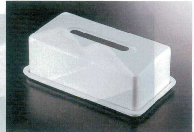
7-1155-5 (80604360) ¥4,200 メラミン深型ティッシュBOX M ホワイト (底トレー) 269×139×100

アメニティ 竹網代シリーズ アクリル小物 メラミン 小物(トレー皿) 樹脂製ティッシュBOX トレー