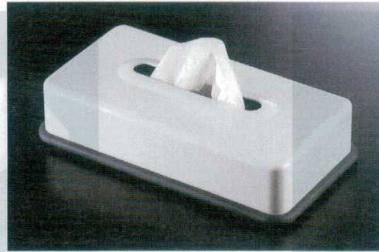
7-1155-2 (80604330) ¥2,950 ABS浅型ティッシュBOXセット A PE ホワイト/グレー OM 269×139×69