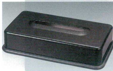
7-1155-9 (51365250) ¥4,350 浅型ティッシュBOX A PE 黒銀パール (底ラバー) 269×139×69