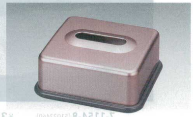
7-1155-8 (51365260) ¥3,300 ハーフティッシュBOX A PE 銀透き (底ラバー) 148×139×69