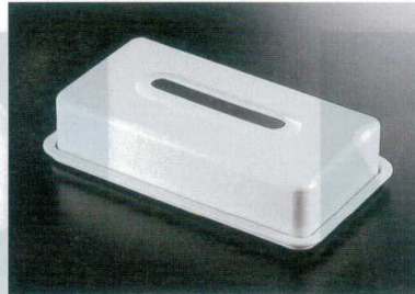
7-1155-4 (80604340) ¥3,150 ABS浅型ティッシュBOXセット A M ホワイト (底トレー) 269×139×69