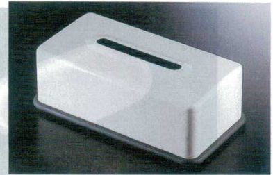
7-1155-3 (80604350) ¥4,050 メラミン深型ティッシュBOXセット M PE ホワイト/グレー OM 269×139×100