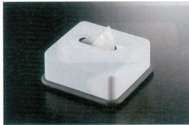
7-1155-1 (80604320) ¥2,300 ABSハーフティッシュBOXセット A PE ホワイト/グレー OM 148×139×69