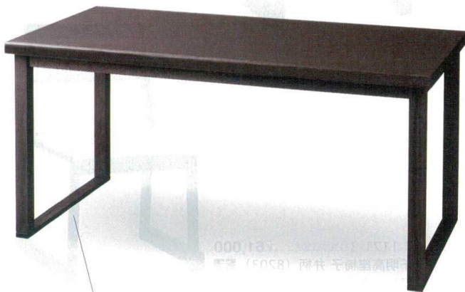
回り脚（そり脚） ※別料金