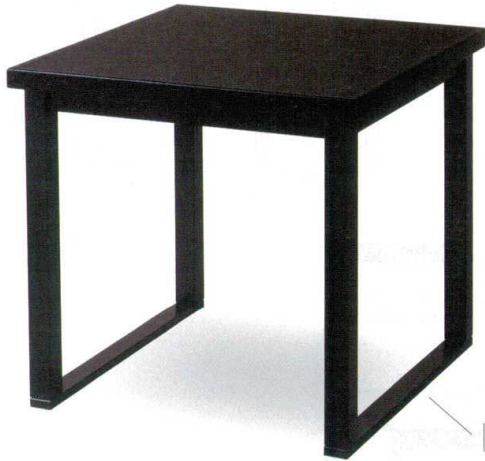
回り脚（そり脚） ※別料金