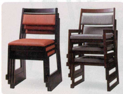
片づけやすくスペースいらず