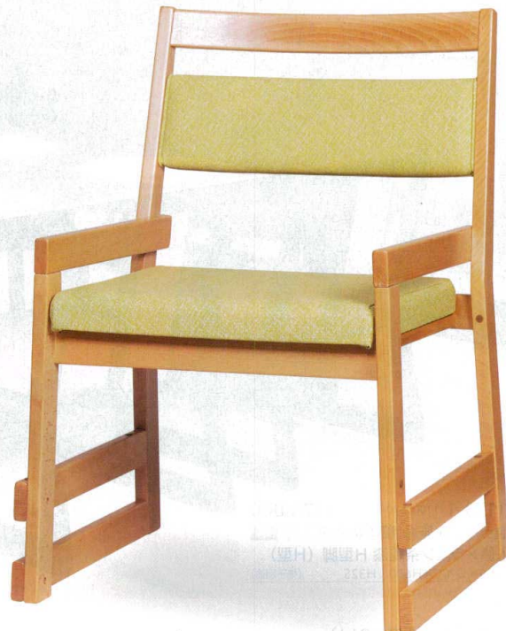
7-1172-1 (11035420) ¥96,000 蓮高座椅子 若草 (8813) 木 フレーム：ナチュラル