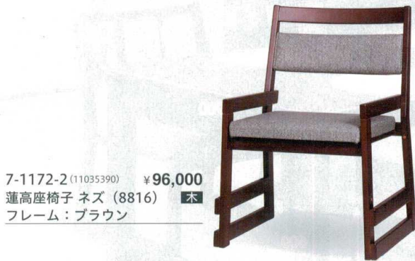
7-1172-2 (11035390) ¥96,000 蓮高座椅子 ネズ (8816) 木 フレーム：ブラウン