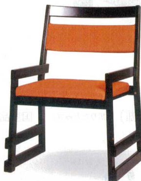
7-1172-3 (11035380) ¥96,000 蓮高座椅子 人參色 (8814) 木 フレーム：ブラック