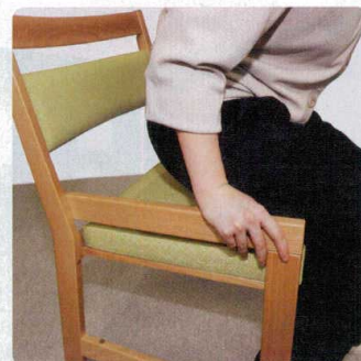
立ちやすく座りやすい安心設計