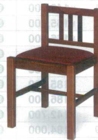
7-1201-8 (17413210) ¥34,000 ケヤキ調格子 茶無地レザー W370×D400×H700