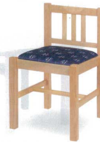
7-1201-6 (17413180) ¥34,000 白木格子 紺かすりレザー W370×D400×H700