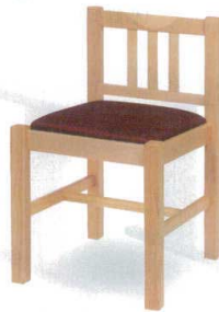
7-1201-5 (17413170) ¥34,000 白木格子 茶無地レザー W370×D400×H700