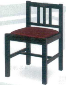
7-1201-2 (17413140) ¥34,000 黒格子 茶無地レザー W370×D400×H700