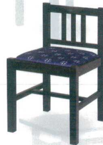
7-1201-3 (17413150) ¥34,000 黒格子 紺かすりレザー W370×D400×H700