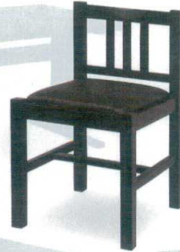
7-1201-1 (17413130) ¥34,000 黒格子 黒無地レザー W370×D400×H700