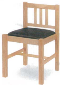
7-1201-4 (17413160) ¥34,000 白木格子 黒無地レザー W370×D400×H700