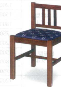
7-1201-9 (17413220) ¥34,000 ケヤキ調格子 紺かすりレザー W370×D400×H700