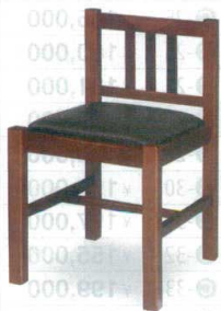
7-1201-7 (17413190) ¥34,000 ケヤキ調格子 黒無地レザー W370×D400×H700