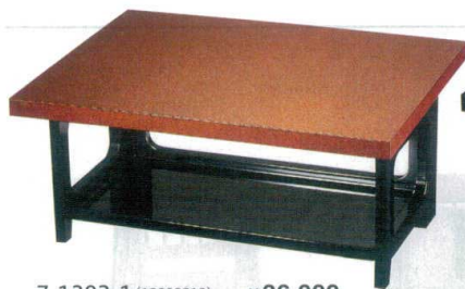
7-1203-1 (12009910) ¥36,000 梨地 A