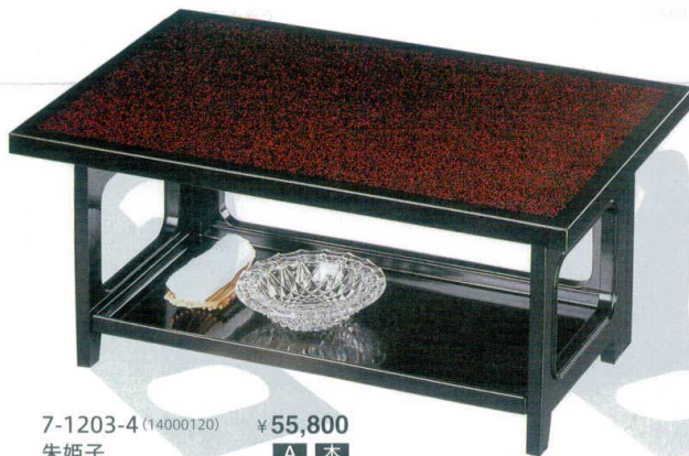
7-1203-4 (14000120) ¥55,800 朱姫子 A 木