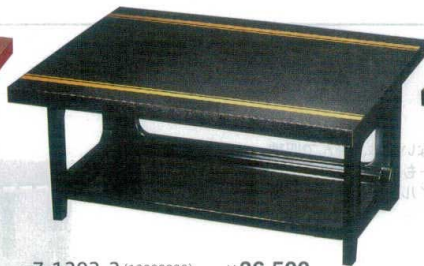
7-1203-2 (12009890) ¥36,500 金ライン 黒タタキ A