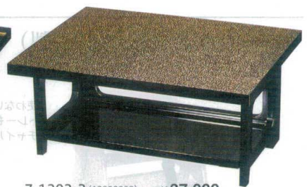
7-1203-3 (12009880) ¥37,000 金ちらし A