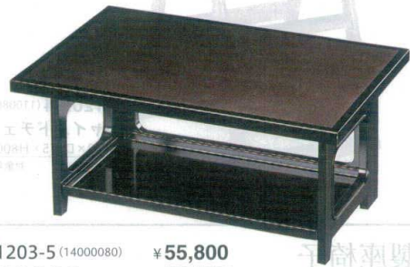
7-1203-5 (14000080) ¥55,800 ウルミタタキ A 木