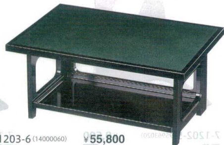
7-1203-6 (14000060) ¥55,800 グリーンタタキ A 木