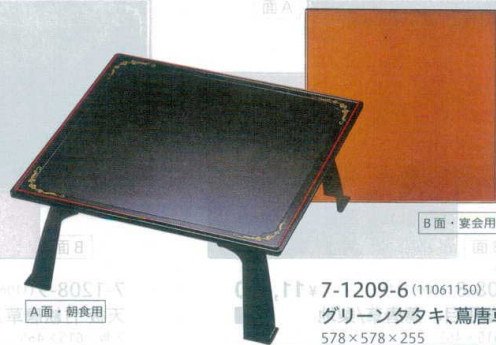
7-1209-6 (11061150) ¥19,000 グリーンタタキ、萬唐草/梨地 A 578×578×255