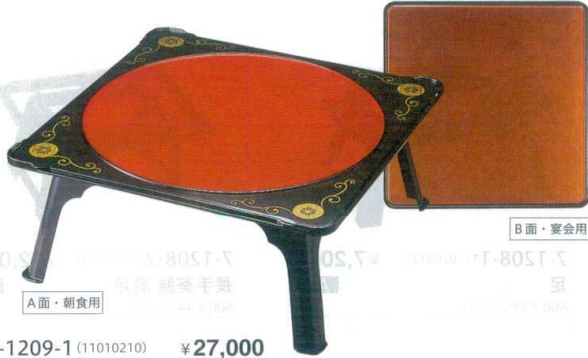
7-1209-1 (11010210) ¥27,000 朱淵黒紋入/梨地、天黒 A 578×578×255