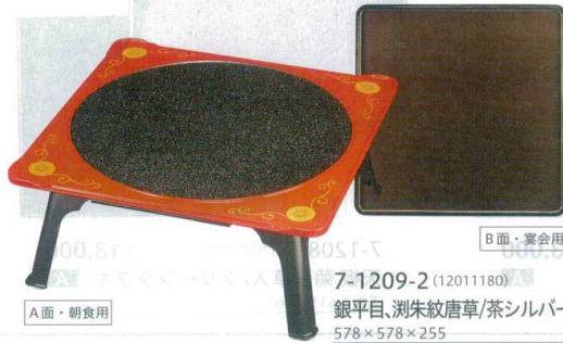
7-1209-2 (12011180) ¥27,500 銀平目、淵朱紋唐草/茶シルバーパール A 578×578×255