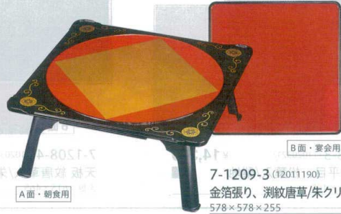
7-1209-3 (12011190) 平巻 ¥40,500 金箔張り、淵紋唐草/朱クリヤータタキ A 578×578×255