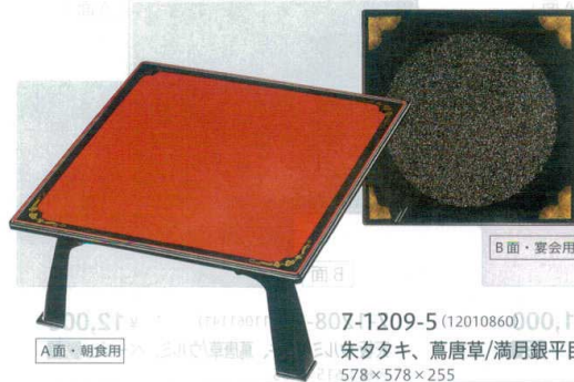
7-1209-5 (12010860) ¥20,000 朱タタキ、萬唐草/満月銀平目、松葉 A 578×578×255