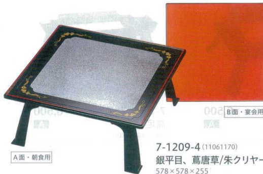
7-1209-4 (11061170) ¥18,500 銀平目、萬唐草/朱クリヤータタキ A 578×578×255